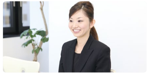
取材中も丁寧な話し方と笑顔を決やさない魅力的な女性でした。

庭の都合を優先できる今の状況にはすごく満足しています。現在は土日を中心に週1、2日、住宅会社のオープンハウスで受付接客をさせていたが、日程があればジョブピングモールの優待セールなどをプラスして、フレキシブルに働かせていただいています。前職も接客のお仕事だったので、経験を活かせることも魅力だと思います。主人が自営業で実母とも同居していますので、出勤するときは、子どもの面倒や食事面もカバーしてもらっています。本当に恵まれているというか、サポートしてくれる家族にも感謝しています。働くことに戸惑いや緊張もありますが、それよりも今は、スーツを着て仕事をすることで「社会に出た実感が湧いてうれしい」という気持ちが本音かもしれません。